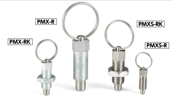
PMX-R ロックナットなし PMX-RK ロックナットつき 単位: mm

*1: PMX-3-M6-0.75-RK のロックナットの材質はSUS303になります。